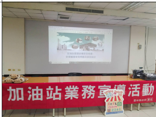
加油站業務宣導活動提倡性平 觀念播放性平宣導影片