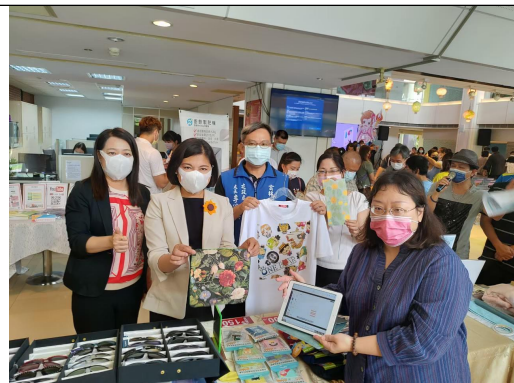
SBIR 成果展表彰廠商對地方產業的付出鼓勵傑出女性的成就