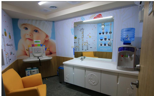
110 年度 SBIR 廠商-糧莘農場 公司設置哺乳室

面對嚴峻的少子女化議題，本處鼓勵企業設置職場友善托育設施，必須積極著手創造生育、養育的友善環境、宣導打造友善生育環境是企業社會責任，並從性別平權觀點來傳達父母應共同擔負育兒責任之觀念。將來應可考慮鼓勵企業啟動男性育嬰假的規定，納為友善職場措施的一環。