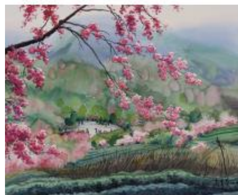
水彩石壁之春(雲林)