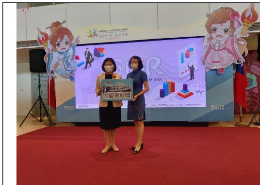
SBIR 成果展表彰廠商對地方產業的付出鼓勵傑出女性的成就

本處鼓勵女性參與地方產業推廣，並表彰傑出女性的成就。培力雲林女性工作發展及活化企業組織，激發婦女對於職場之發展潛能，提升自主經濟力。本年度(110 年)申請雲林縣 SBIR 創新研究開發計畫之廠商共有 38 家，其中女性負責人為 20 位，比例高達 53%。