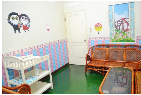
110 年度 SBIR 廠商-西螺大同醬油 公司設置哺乳室